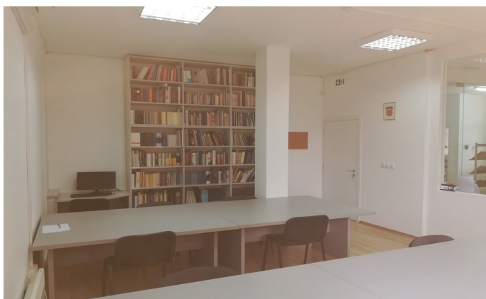
Slika 3. Zbirka Državnoga arhiva u Šibeniku

od tisuću godišnje), uglavnom profesori, studenti, privatne osobe i istraživači, koje najviše zanimaju matične knjige, stari nacrti, rodoslovlja i različite struke, posjećuju ovu zbirku radi stručnih skupova ili projekata i sl. Iako prema sistematizaciji radnih mjesta šibenskoga Arhiva radno mjesto diplomiranoga knjižničara postoji, dosad on, zbog nedostatka financijskih sredstava, nije zaposlen.