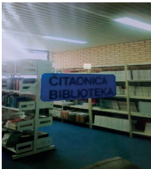
Slika 1. Knjižnica Opće bolnice Šibensko-kninske županije