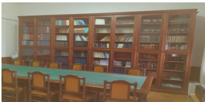
Slika 4. Zbirka Županijskoga suda u Šibeniku