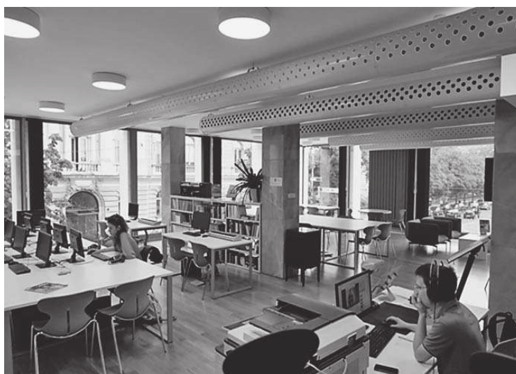
Slika 3. Čitaonica u novoj zgradi

Suvremena oprema novog prostora za Muzičku akademiju značila je skok u 21. stoljeće (Slike 2 i 3). Korisnici knjižnice su prvi puta u povijesti ustanove dobili čitaonicu, koja je omogućila korištenje novih usluga – mrežnih publikacija, baza podataka, digitalnih zvučnih snimaka, rad s programima za obradu notnog teksta uz klavijature i slobodno skeniranje. Olakšano je i korištenje vlastitih digitalnih proizvoda – repozitorija ocjenskih radova DRMA (osnivanjem repozitorija smješten u DABAR) i digitaliziranih rukopisa iz zbirke rijetkosti, smještenih u repozitoriju Muzičkog in-