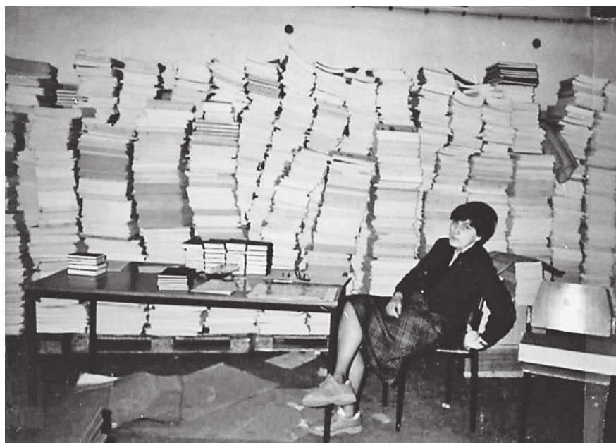
Slika 4. Donacija Edition Peters razvrstavala se u podrumu Koncertne dvorane V. Lisinski

poznala tu činjenicu i nastoji osigurati redoviti godišnji priljev sredstava za kupovinu građe – primarno iz vlastitih sredstava. U nekom razdoblju, masom sredstava od školarina je upravljalo Sveučilište u Zagrebu – sastavnice su trebale aplicirati na natječaje za projekte unaprjeđenja određenih segmenata djelatnosti. Danas je obavezno 1/3 prihoda od školarina utrošiti za unaprjeđenje nastave, pa tako i na nabavu literature. Njime se nabavljaju novi kvalitetni materijali potrebni u nastavi – nove knjige i suvremena notna izdanja s inozemnog tržišta, prema zahtjevima predmetnih nastavnika. Kako je Akademija useljnjem u nove prostore došla u nezavidan položaj gdje nema osigurana sredstva za četiri puta veće režijske troškove korištenja suvremeno opremljene zgrade, iz godine u godinu sve je teže novac predviđen za nabavu knjižnične građe i utrošiti za tu namjenu. Pogotovo nije moguće kupovati u skladu sa Standardima za visokoškolske knjižnice , koji određuju po 3 sveska omeđenih publikacija po svakom studentu. Kupuje se po jedan primjerak odabranog naslova.