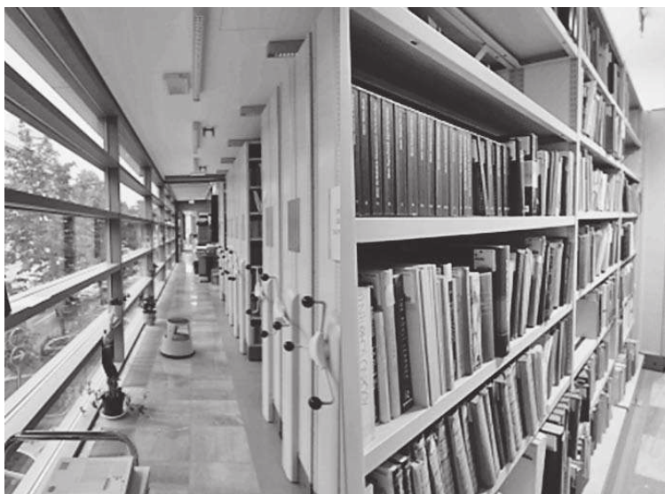
Slika 2. Spremište knjižnice u novoj zgradi

cima i bez bežične mreže, dovršavajući i reviziju kompletnog fonda. Ubrzo su u novo, veliko i čisto spremište dopremljene i odjelne zbirke. 6