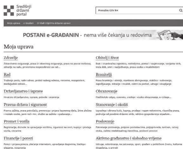
Slika 1. Središnji državni portal (dostupno na: http://vlada.gov.hr/sredisnji-drzavni-portal/203 )

Središnji državni portal 21 (Slika 1.) je internetsko mjesto koje služi za jednostavan pristup svim informacijama javne uprave, a namijenjen je građanima. Ovdje su informacije organizirane u tematske cjeline s obzirom na potrebe građana za javnim uslugama.