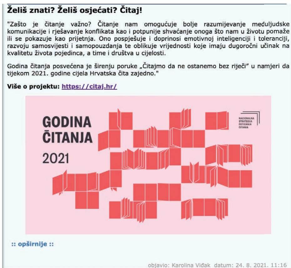
Slika 3. Primjer objave – promotivni tekst objavljen na mrežnim stranicama srednje škole u Splitsko-dalmatinskoj županiji