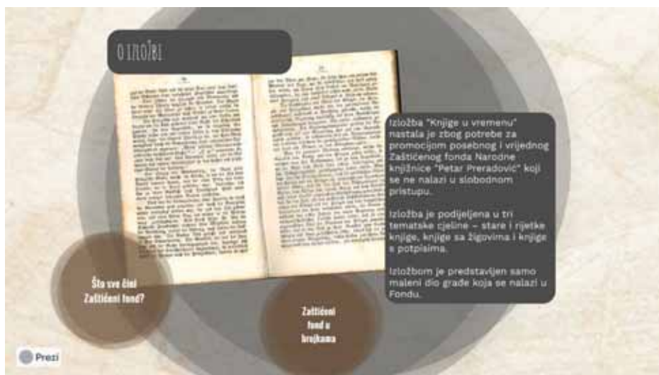
Slika 3. Virtualna izložba Knjige u vremenu ( https://knjiznica-bjelovar.hr/virtualne-izlozbe/knjige-u-vremenu/ )

Prva virtualna izložba postavljena je povodom nacionalne manifestacije koja promiče knjigu i čitanje pod nazivom „Noć knjige“ 23. travnja 2020. godine pod naslovom „Zabranjeno čitanje“. Cilj te virtualne izložbe bio je prisjetiti se knjiga koje su iz raznih razloga bile kontroverzne i nepoćudne te su sadržavale ideje koje su se svojevremeno smatrale opasnim. Za svaki naslov navedena je i poveznica na mrežni katalog Knjižnice, a za neke i poveznica na e-knjigu (Project Gutenberg i eLektire).