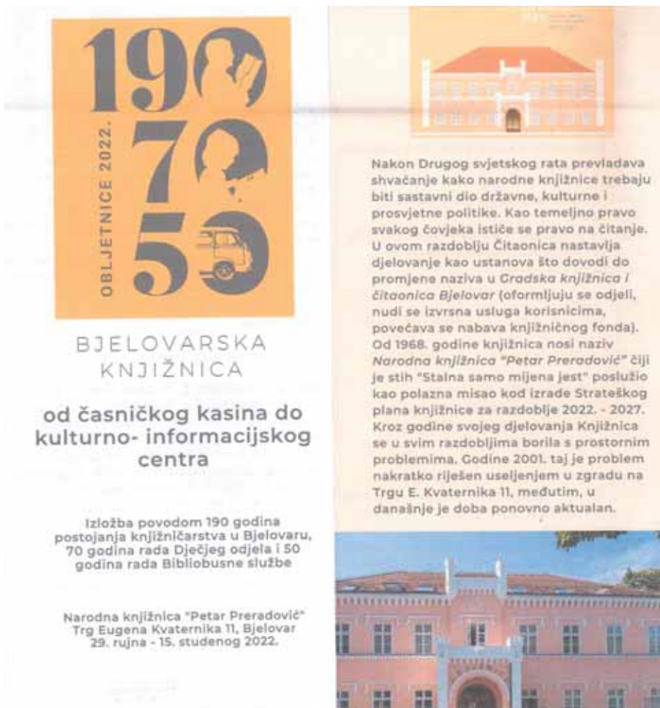
Slika 2. Bjelovarska knjižnica: Od časničkog kasina do kulturno-informacijskog centra