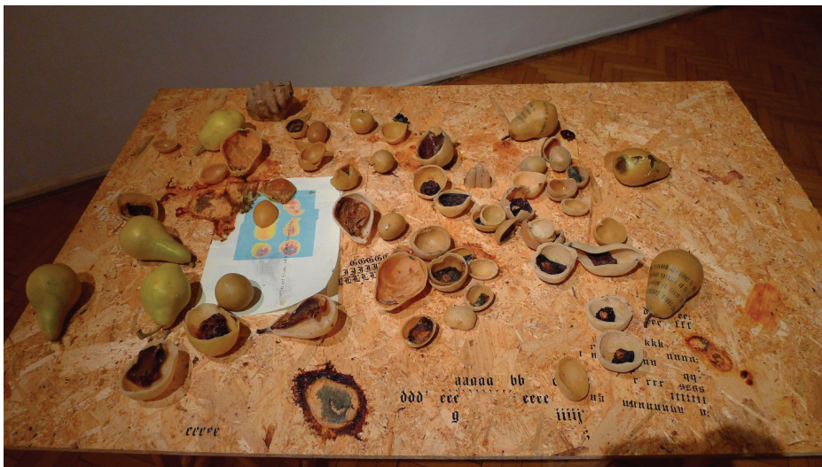
Slika 4. Valentina Butumović, Mrtva priroda, 2021. godine. Primjer konstruktivnog pristupa.

Drugim riječima, konstruktivni ekološki pristup u umjetničkim djelima može se temeljiti na educiranju publike i podizanju svijesti o ekološkoj krizi, također može ohrabrivati aktivizam i poticati publiku na rješavanje ekoloških problema, stvaranje djelatnih zajednica vezano za određene partikularne probleme, a jednako se tako može temeljiti na upotrebljavanju održivih materijala ili recikliranju te se nadahnjivati prirodom i ekosustavima naglašavajući važnost njihova očuvanja. Konstruktivan ekološki angažman u umjetničkim radovima ima svrhu potaknuti pozitivne promjene, educirati ljude o važnosti očuvanja okoliša te potaknuti djelovanje za bolju budućnost planeta.