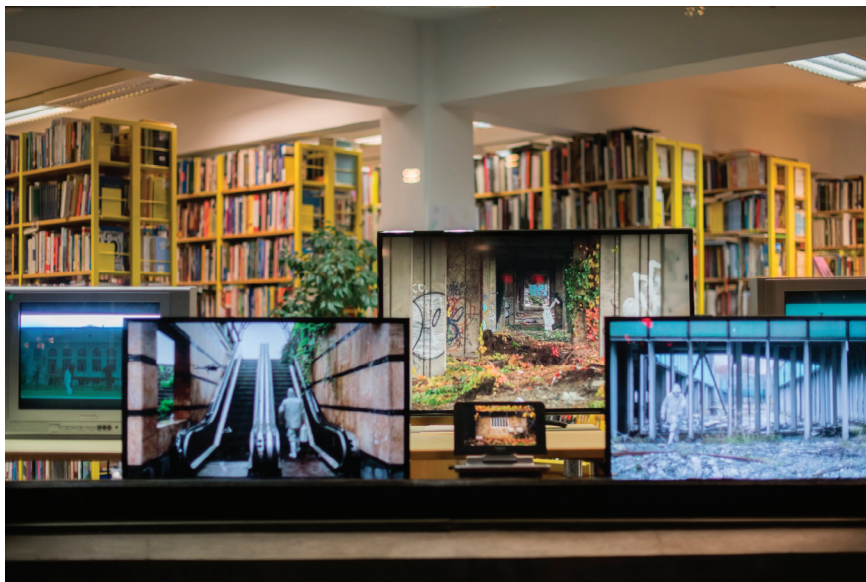
Slika 5. Gildo Bavčević, Može više! Mora više! , 2020. Primjer kritičkog pristupa.

Drugi pristup koji obilježava izložbenu djelatnost Galerije Prozori u kontekstu ekološke tematike jest kritički pristup unutar kojeg je svrstano šest radova. Pritom se svi radovi kroz ekološku perspektivu referiraju na širu društveno-političku situaciju u kojoj nastaju i njezine neuralgične točke. Tako rad Gilda Bavčevića Može više! Mora više! iz 2020. godine proizlazi iz propitivanja odnosa tehnološki razvijenog društva i njegovih resursa koji se usprkos pojačanom nadzoru i kontroli rasipa i troši (slika 5).