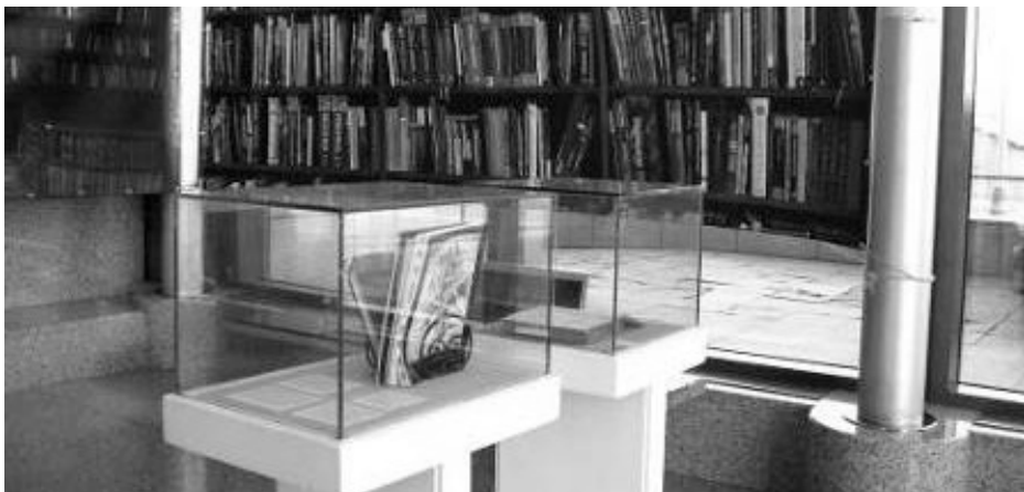
Slika 4. Prikaz dijela postava s panoramskim fotografijama na izložbi „Knjige pričaju o 100 godina Medicinskog fakulteta“ otvorenoj u Nacionalnoj i sveučilišnoj knjižnici u Zagrebu 14. prosinca 2017. godine