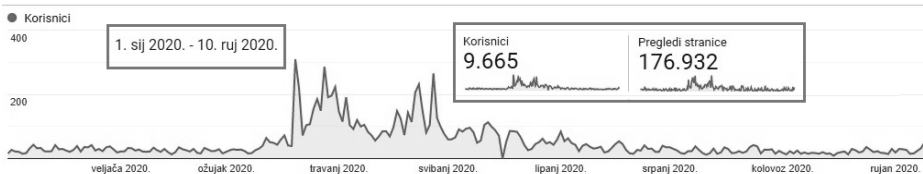
Slika 1. Grafički prikaz posjeta na portalu Digitalne zbirke KGZ-a od 1. 1. do 10. 9. 2020.

U odnosu na prethodnu godinu, broj posjeta portalu Digitalne zbirke porastao je za 111 %, s 4 578 posjetitelja u 2019. godini na 9 656 posjetitelja u 2020. godini (slika 1). Broj pregleda porastao je za 65 %, sa 107 409 pregleda u 2019. godini, na 176 932 u 2020. godini. 5