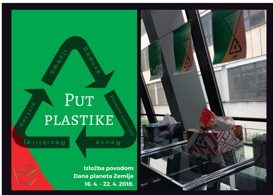
Slika 2. Plakat i fotografija s izložbe „Put plastike“

Predstavljeni plakati opisali su međunarodne oznake za različite vrste plastičnih materijala koji se mogu reciklirati. Slova je skraćena oznaka kemijskog spoja od kojeg je ambalaža načinjena, dok se unutar petlje nalazi i proizvoljno dogovorena brojana oznaka. Izložbom se htjela naglasiti razlika između sigurne i rizične plastike te podučiti o pravilnom recikliranju i vrstama plastike kako bi se neki predmeti iznova rabili bez gomilanja.