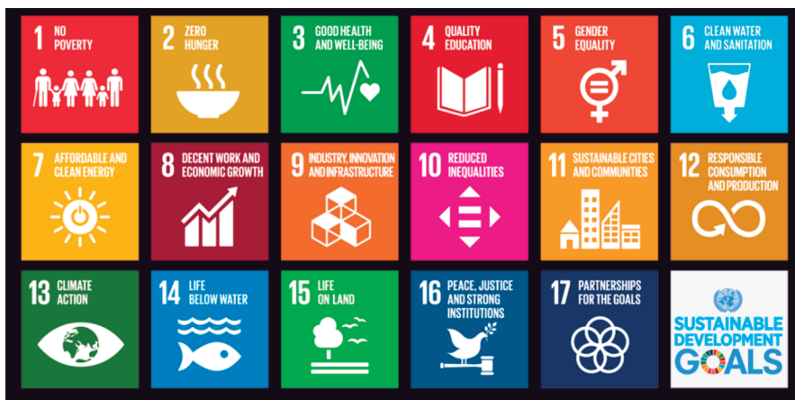
Slika 4. Ciljevi održivog razvoja 20

Ciljevi održivog razvoja prikazani su na slici 4.