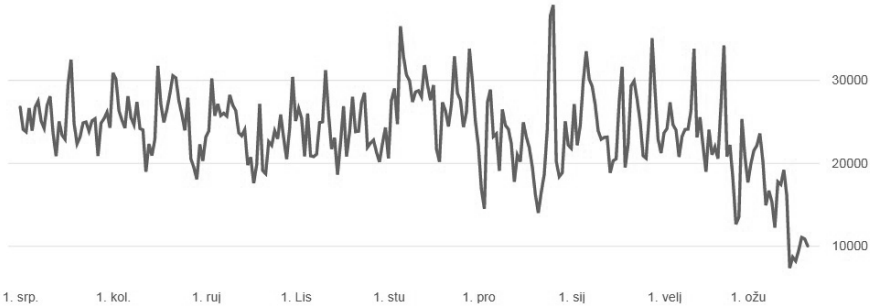
Slika 2. Rast grupe od 1. 7. 2021. godine, do 21. 3. 2022. godine.

391.111 Viewed ⓘ ▼ 93,36% prema 27. velj 2022. 26. ožu 2022.