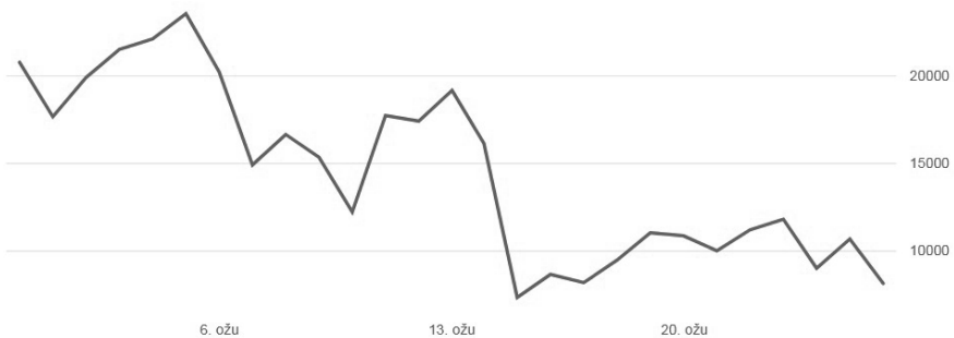
Slika 3. Vidljivost (doseg objava) – rast grupe nakon uvođenja restrikcija u posljednjih 28 dana

391.111 Viewed ⓘ ▼ 93,36% prema 27. velj 2022. 26. ožu 2022.