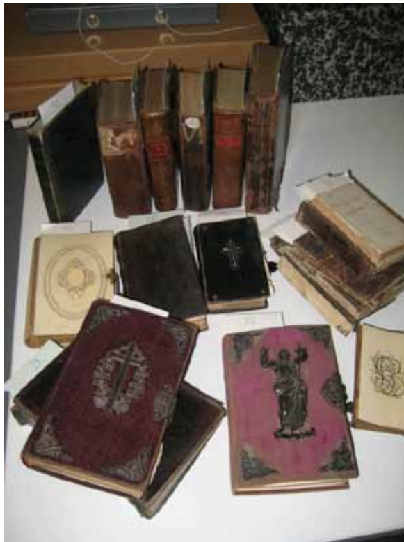
Slika 2. Stari molitvenici (19. st.) iz donacije Gotthardi-Škiljan, u trenutku obrade

Knjižnica HAZU našla se ne samo pred profesionalnim izazovom zbrinjavanja bogate knjižne ostavštine, nego i pred obvezom pronalaska dostojnog vlasnika, koliko bude u mogućnosti, svakom primjerku koji je odigrao važnu ulogu u privatnim i profesionalnim životima darovatelja.