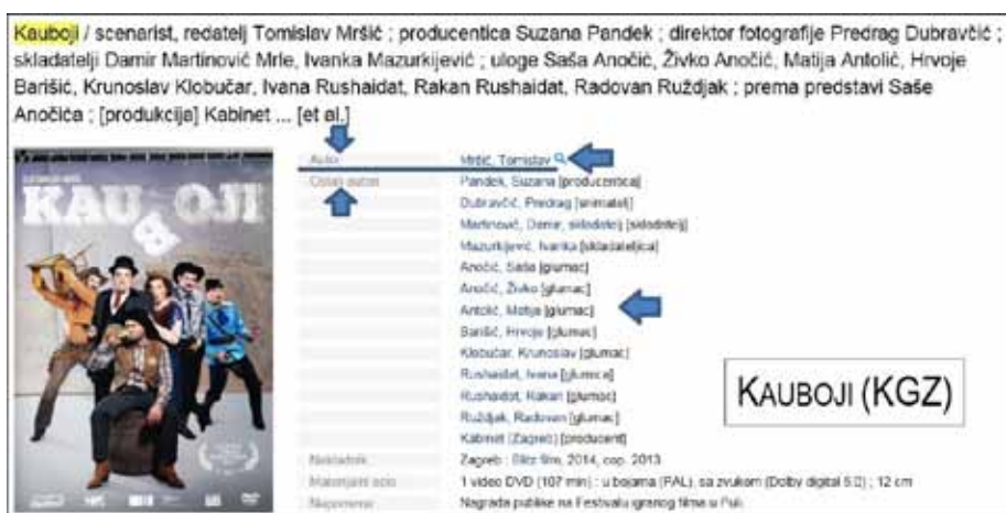
Slika 7. Kauboji – neophodna pristupnica za ime redatelja, dodatne pristupnice za imena/nazive navedene u podacima o odgovornosti (Knjižnice grada Zagreba)

Za bibliografski zapis igranog filma hrvatske filmske produkcije, Knjižnice grada Zagreba navode neophodne pristupnice za imena redatelja i dodatne pristupnice za imena scenarista, producenata, snimatelja, skladatelja, glavnih glumaca, autora adaptiranog djela te za produkcijske kuće koje su djelo realizirale.