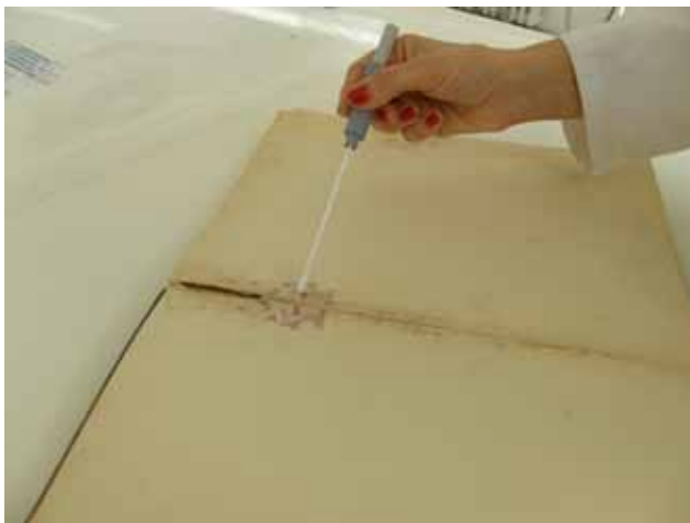
Slika 12. Uzimanje brisa s biološki ugroženih objekata

Tri knjige (VČ7884, TĐ2298 i VČ5154) su tretirane timolom u Veloxly sustavu tako što su stavljene u plastične vakuum vreće (dimenzija 0,5 x 0,5 m, s dva ventila) (Slika 13). Zapremina vreće izračunata je prema formuli: V=W^3(h/pxW - 0.142 (1-10^{-(h/W)})) , a količina timola (1.7 g) koja se također dodaje u vreću izračunata je prema uobičajenom empirijskom protokolu (1000 l : 70 g). Tri knjige (VČ4735, TĐ2297, VČ4874) su stavljene u drugu vreću na isti način kao i prethodne, samo bez upotrebe timola (pomoću Veloxly sustava ubačen je zrak kome je uklonjen kisik do 0,04 posto, normalna koncentracija kisika u zraku je 21 posto).