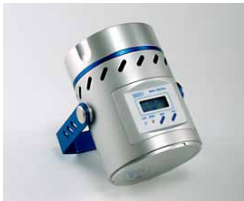
Slika 3. Air Sampler

Air sampler MAS 7 (Microbial Air Monitoring System)-100 Eco® (Slika 3) je uređaj visokih performansi zasnovan na načelu Andersonovog uzorkivača zraka. Zrak se uvlači kroz perforirani poklopac i izravno pada na površinu podloge za rast mikroorganizama koji se nalazi u standardnoj 90 mm petrijevoj zdjelici ili na 60 mm kontaktnu ploču. Uređaj ima stalan protok zapremine od 100 litara / min. Ukoliko su prisutni mikroorganizmi, oni napadaju hranjivu podlogu i nakon vremena inkubacije se otkrivaju, određuju i broje njihove kolonije.