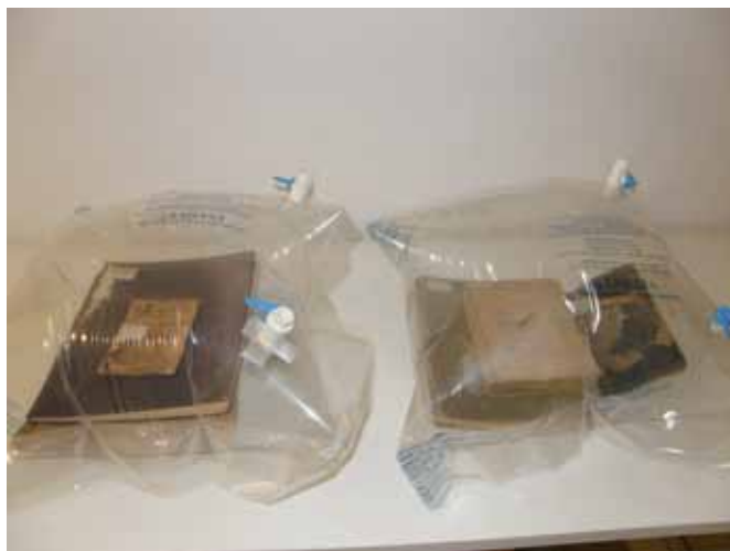
Slika 14. Izgled građe u vrećama sa zrakom bez kisika i s timolom

Tretiranje je trajalo 21 dan, što daje mogućnost uništavanja, pored aerobnih mikroorganizama, i eventulnih insekata u svim fazama razvoja (Slika 14). Poslije ovog razdoblja, rađeno je ponovno uzorkovanje i očitavanje LI-GHTNING MVP® uređajem.