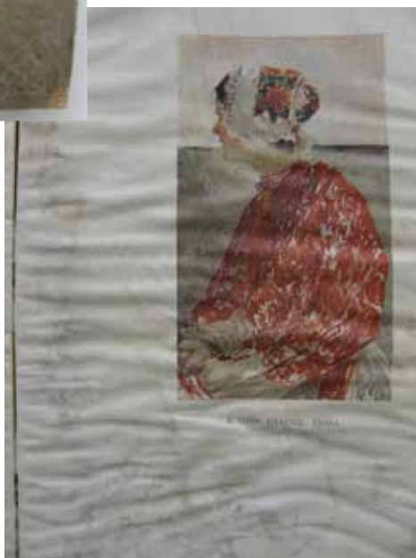
Slika 7. Naslovna stranica i područje biološkog oštećenja