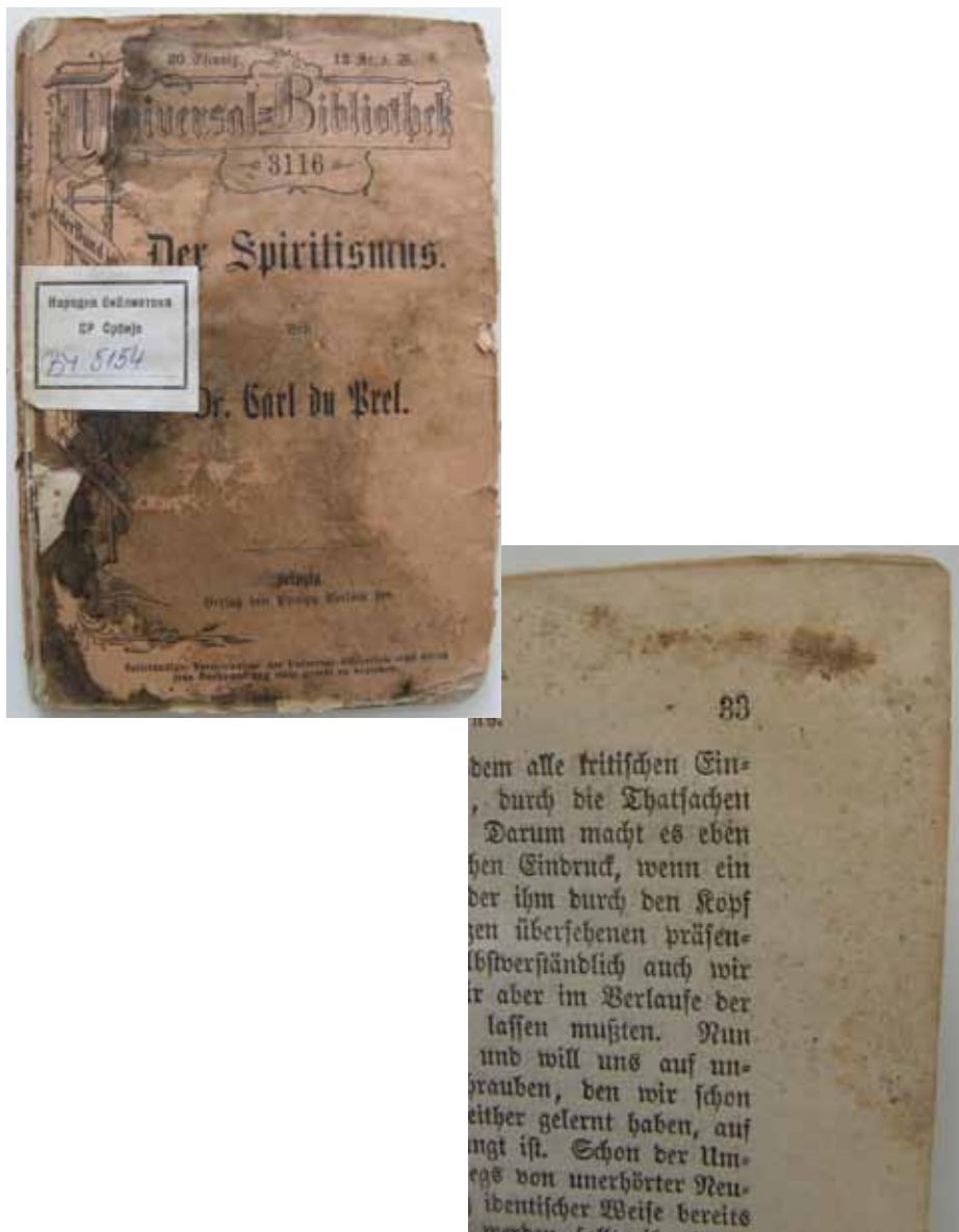
Slika 10. Naslovna stranica i područje biološkog oštećenja