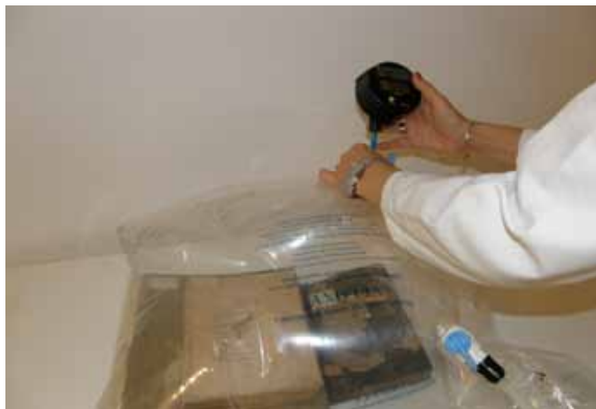
Slika 13. Izrada vakuum vreća, montiranje ventila, provjera postotka kisika oksimetrom

Tretiranje je trajalo 21 dan, što daje mogućnost uništavanja, pored aerobnih mikroorganizama, i eventulnih insekata u svim fazama razvoja (Slika 14). Poslije ovog razdoblja, rađeno je ponovno uzorkovanje i očitavanje LI-GHTNING MVP® uređajem.