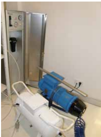
Slika 4. Veloxi uređaj

Veloxi sustav temelji se na ideji što manje upotrebe kemijskih sredstava u postupku konzervacije. Sva do sada korištena kemijska sredstva u radu, bez obzira koliko bila učinkovita pri suzbijanju mikroorganizama i insekata, ipak mogu oštetiti strukturu papira i nepovoljno utjecati na osoblje koje sudjeluje u radu ako se nalazi u prostoriji u kojoj se obavlja postupak. Europska unija je 1998. godine financirala projekt "Save Art" (Spasiti umjetnost). Dio ovog projekta sačinjava "Pre Mail" projekt, koji vodi švedski Prirodoslovni muzej. U sklopu tog projekta testirane su različite metode suzbijanja štetnika. 10 Jedna od metoda sastoji se u učinku dugotrajnog skladištenja predmeta zaštite u prostoru s atmosferom s niskim postotkom kisika. Konstruiran je uređaj koji predstavlja elektromehanički generator dušika (the Veloxi – very low oxygen, što znači veoma niska razina kisika) (Slika 4).