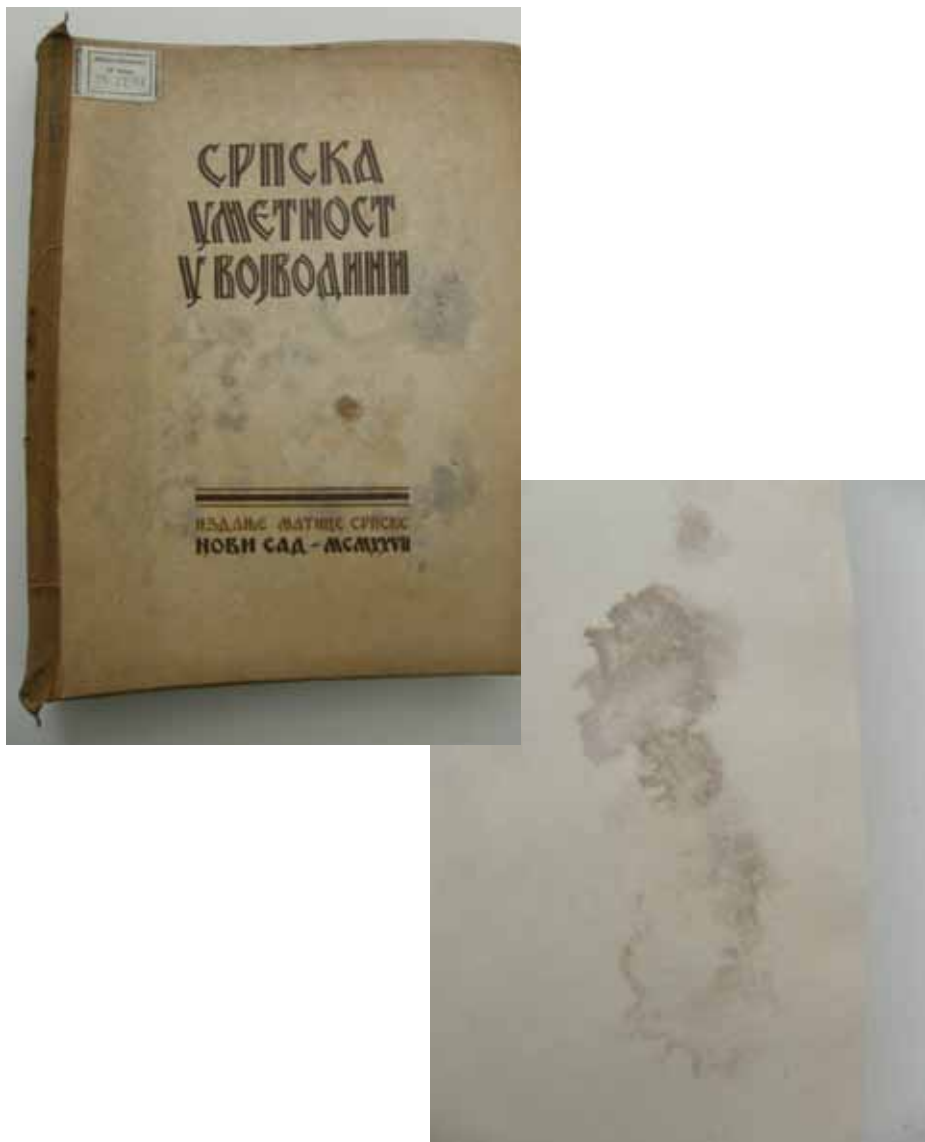
Slika 8. Naslovna stranica i područje biološkog oštećenja