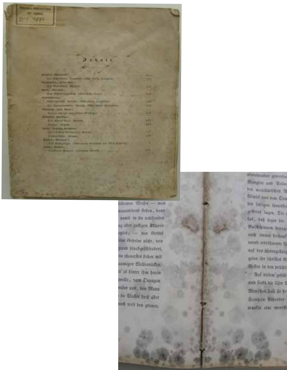
Slika 9. Naslovna stranica i područje biološkog oštećenja