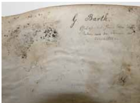
Slika 5. Naslovna stranica i područje biološkog oštećenja