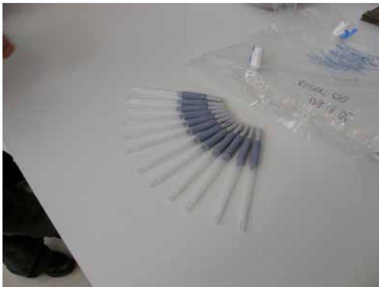
Slika 11. Kivete za pojedinačno uzorkovanje

Za uzimanje briseva s biološki ugroženih površina (listovi papira iz prethodno navedenih knjiga) upotrebljavane su plastične kivete za pojedinačno uzorkovanje (64003-100 LIGHTNING MVP ATP Surface Sampling Device) proizvođača Biocontrol USA (Slika 11). Za očitavanje rezultata bioluminescencije korišten je uređaj LIGHTNING MVP® istog proizvođača.