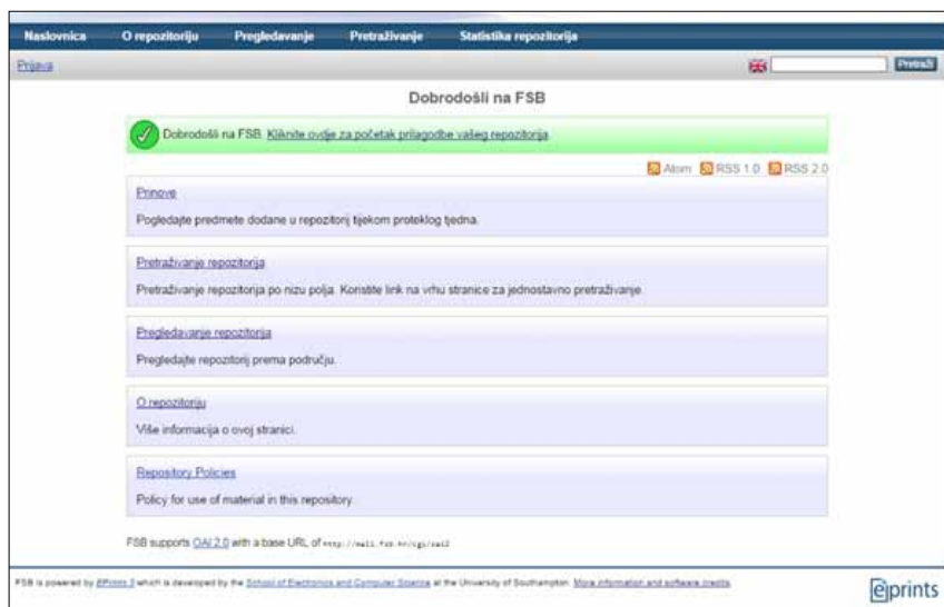
Slika 3. Sučelje programa ePrints

Licenca za korištenje ePrintsa je također GPL.