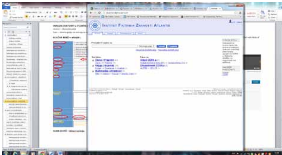
Slika 4. Sučelje programa Invenio