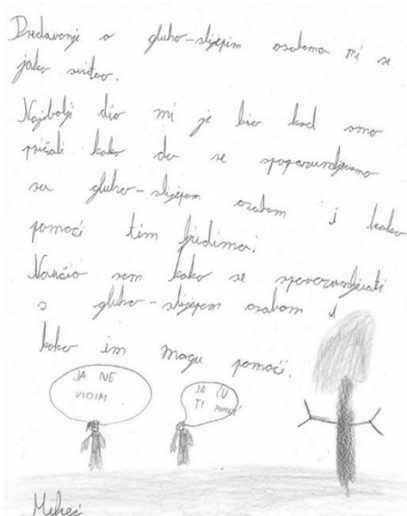
Slika 5. Primjer dječjeg rada

„Jako mi se svidjelo što sad znam kako mogu pomoći svom susjedu koji ne vidi.“ Elza