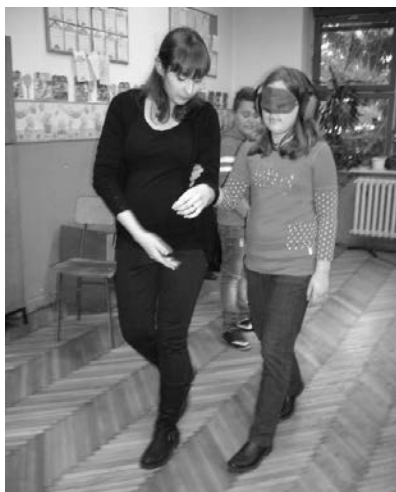
Slika 1. Simulacija vođenja gluhoslijepe osobe

tako, saznali su da se gluhoslijepe osobe ne mogu same brinuti za svog psa i zato ga nemaju ako se netko ne može brinuti za njega.