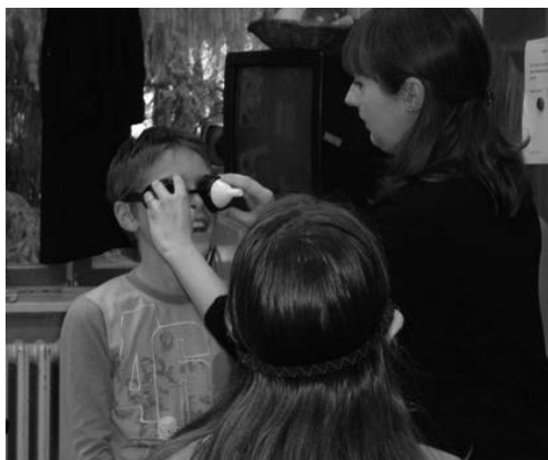
Slika 2. Simulacija tunelskog vida

Učenici su bili iznimno zainteresirani i postavili su mnogo pitanja. Nakon što su osjetili kako je to ne vidjeti i ne čuti, dobili su veliku želju da pomognu. Željeli su saznati za što više načina na koje mogu pomoći.