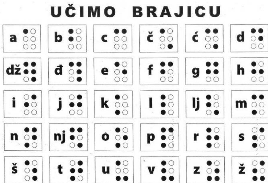
Slika 3. Predložak za učenje brajice

Zadatak je bio opipom ih prepoznati i spariti riječi na različitim pismima.